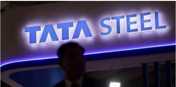
AGGRESSIVE EXPANSION. A former CPSE, NINL was acquired by Tata Steel in 2022

A former CPSE, the company was acquired by Tata