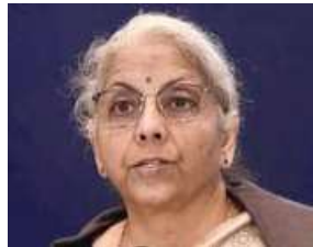
Nirmala Sitharaman, Finance Minister

The proposals for categorisation are to be furnished to the DPE with the concurrence of the financial advisor and the approval of the Minister-in-charge of the administrative Ministry/Department concerned. The